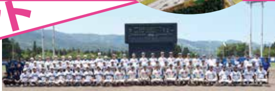
昨年春の招待試合、花咲徳栄高と六日町高、塩沢商工との記念写真