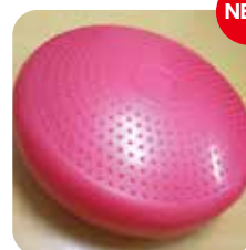
NEW バランスディスク 2個