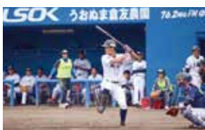
昨年開催された西武対ヤクルトの一戦