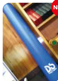
NEW ストレッチボール