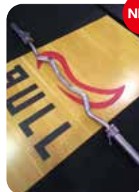
NEW アームカールバー