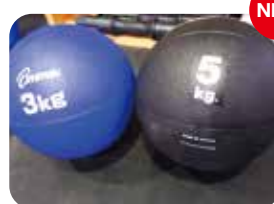
NEW メディシンボール 3kg、5kg

トレーニングジムでご利用頂ける備品が新しく導入されました。これまでよりたくさんトレーニングメニューを行えるようになり、より充実したトレーニングを行うことができます。皆様のお越しをお待ちしております。 (注) 備品の数には限りがありますので譲り合ってお使いください。