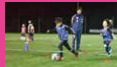
昨年のサッカーフェスタ in 南魚沼の様子

「もっとサッカー技術の上達を目指したい」 「これからサッカーを始める初心者」 「サッカーを通じてもっと運動をしたい」など、 どなたでもご参加いただけます。