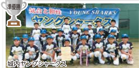
城内ヤングシャークス