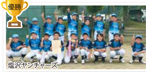
塩沢ヤンチャーズ

9月26日、10月3日・4日に大原運動公園と二日町グラウンドで「第5回ベースボール・マガジン杯魚沼地区新人野球大会」が開催され、南魚沼市郡と魚沼市から19チームが参加しました。決勝は塩沢ヤンチャーズが城内ヤングシャークスに5-3で勝利し、優勝に輝きました。3位決定戦は上関ファイターズが上田トラウツAに11-2で勝利しました。