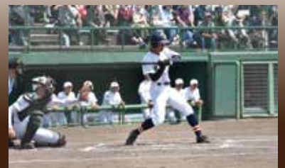
今春県大会の熱戦模様

第101回全国高等学校野球選手権新潟大会が7月6日に開幕します。高校野球の公式戦初開催となるベーマガSTADIUMでの試合は1、2回戦が7月8日~12日の間の4日間行われる予定で、6月22日の抽選会で試合開催日と組合せが決定します。 南魚沼市初開催の甲子園予選をぜひ球場でお楽しみください。