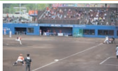
2年ぶりの開催となったBCリーグ公式戦