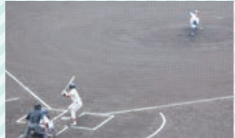
初開催の関甲新1部リーグ戦