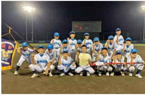
優勝の塩沢ヤッターズ

8月7日から29日にベーマガSTADIUMで「第2回市長杯BBM夏休み少年野球ナイタートーナメント」が行われました。小学校の夏休み期間を利用し熱中症対策も兼ね、試合をナイターで行うこの大会に市郡内の16チームが参加しました。決勝に進んだのは城内ヤングシャークスAと塩沢ヤッターズ。試合は初回に塩沢ヤッターズが先制点を奪うと2回以降も打線がつながりリードを広げていく。城内ヤングシャークスAが最終回に1点返すも、7対1で塩沢ヤッターズが勝利し、優勝に輝きました。