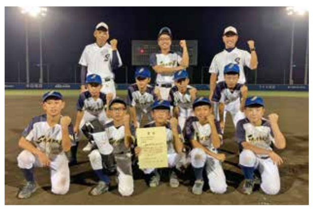
準優勝の城内ヤングシャークスA