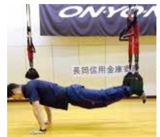
バンジーフィットネスの使用例

器具は5つなので最大5名様までとなります。小学生以下のお子様だけでのご利用はできません。保護者の同伴が必要になります。