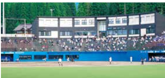
ベーマガSTADIUMでどんなドラマが展開されるか

長い歴史のある高校野球ですが、なんと南魚沼地区で公式戦が開催されるのは今回が初めて。“令和初・南魚沼市初”の夏の甲子園予選を、ぜひ球場でご覧ください。