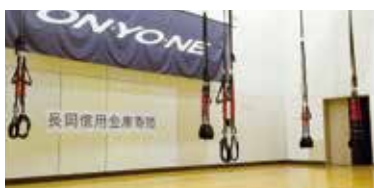
ステージに設置されたバンジーフィットネス

7月1日より南魚沼市トレーニングセンターステージにおいて4Dproバンジーフィットネスの利用が可能になりました。