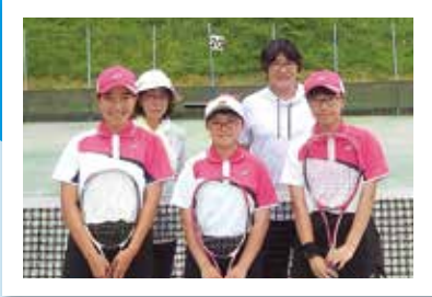
ユーターケーセブン