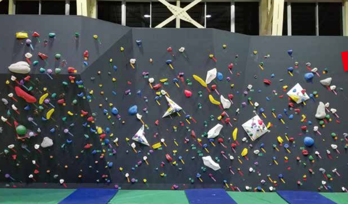
完成したボルダリングin2019