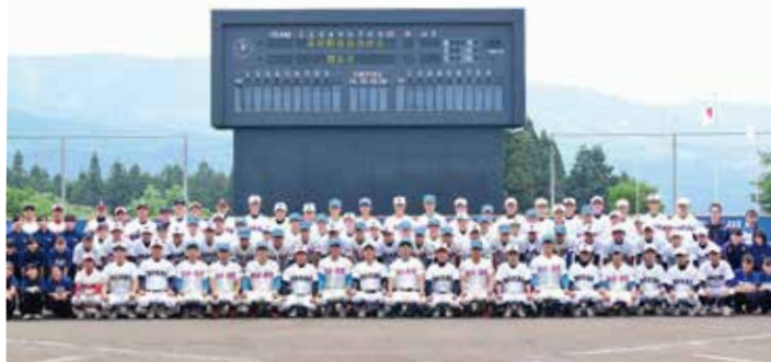
閉会式後、花咲徳栄と六日町、塩沢商工・松代・十日町総合連合チームが記念撮影