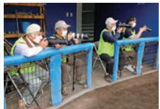
スポーツ写真教室参加者の皆様