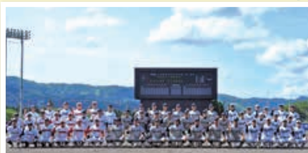
6月4日(佐久長聖、十海塩松、小千谷)