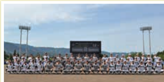
6月5日(佐久長聖、六日町、小出)