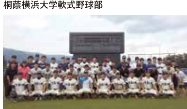
桐蔭横浜大学軟式野球部