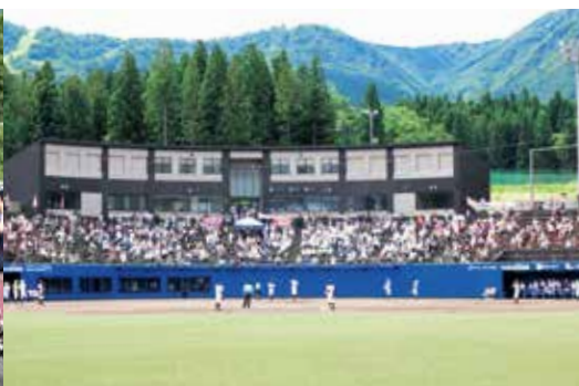
写真はベーマガSTADIUMでの今夏大会熱戦風景