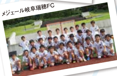
メジャー岐阜瑞穂FC