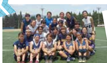
聖心女子大学ラクロス部