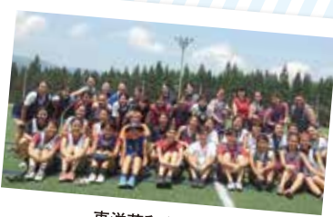
東洋英和女学院大学ラクロス部