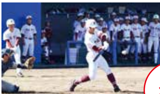
昨年の常総学院招待試合