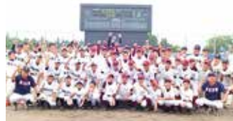
1日目午後の部終了後に全員で記念撮影

今秋も全国屈指の強豪・常総学院を招き、南魚沼市及び近隣地域の高校との試合を行います。10月5日(土)・6日(日)の2日間で計5試合を予定。開始時間等のスケジュールはペーマガスポーツ通信、大原運動公園公式SNSにて追って発表いたします。全国レベルの高校野球をぜひ球場でご覧ください。