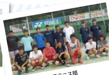
前橋育英高校男子テニス部