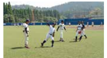
中学生一人ひとりに丁寧に教える 新潟医療福祉大学の選手