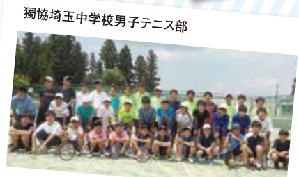
獨協埼玉中学校男子テニス部