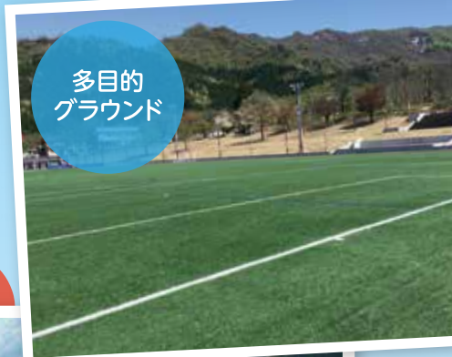
多目的 グラウンド

2026年度も、みなさんの“楽しい”が集まる場所になりますように。たくさんのご来場、お待ちしております!