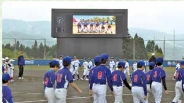
開会式の入場行進の様子