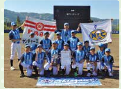
優勝の塩沢ヤンチャーズ