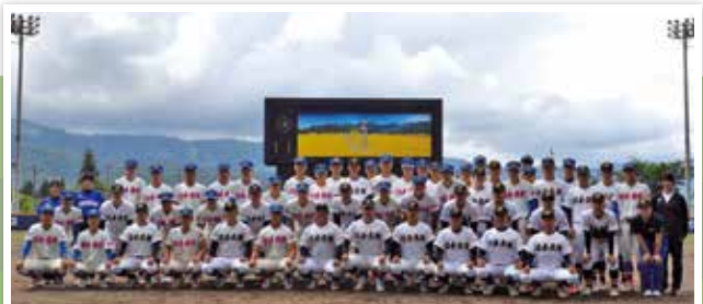
花咲徳栄と日本文理