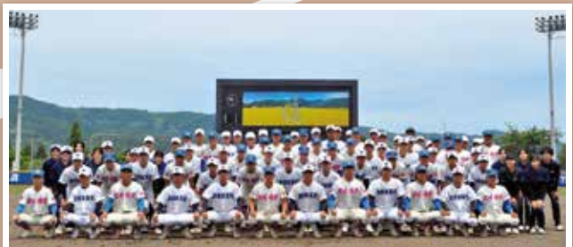
花咲徳栄と六日町