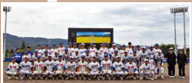
花咲徳栄と小千谷