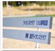
多目的グラウンドA面に 設置してあります

ライオンズクラブ100周年を記念し、塩沢ライオンズクラブ様からアルミ製のベンチ4台を寄贈していただきました。