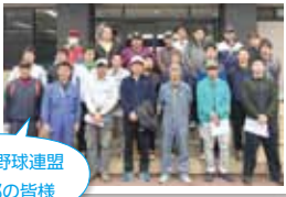
南魚沼市野球連盟 塩沢支部の皆様

4月22、23日に大原運動公園全体のオープン準備が行われました。テニスコートは六日町高校テニス部と八海高校テニス部の皆様、ベーマガSTADIUMは南魚沼市野球連盟塩沢支部の皆様にご協力をいただきました。貴重な練習時間やお休みを割っていただき、ありがとうございました。