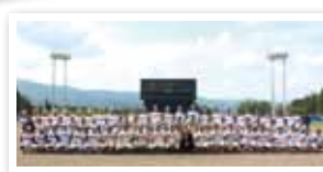
2016年6月4日、5日の花咲徳栄高校招待試合の様子

※試合開始時間はあくまでも予定です。天候やチーム事情により、試合開始時間が変更になる場合がございます。 ※雨天中止の場合、順延はありません。