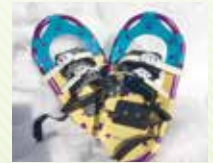
写真は実物と異なります