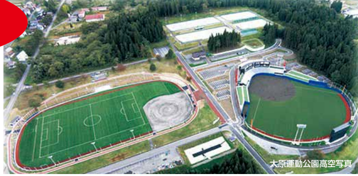
大原運動公園高空写真

平成28年度のご利用については、例年通り、公的行事を優先させていただきます。混雑と集中を避けるため、予約・受付を以下の通り実施致します。ご理解とご協力をお願い申し上げます。